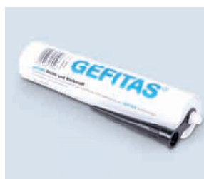
Dicht- und Klebstoff • präzise

Der Klebstoff in der Kartusche gewährleistet eine einfache und genaue Dosierung beim Anschluss der Abdichtung an die Mauerwerkssperre sowie beim Verbinden der Kopfstöße der Bahnen.