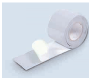
Fixierband • flexibel

Das Fixierband ist ein hoch elastisches und formbares Butylklebeband für die Herstellung von Ecken, zum zusätzlichen Abdichten von Durchdringungen, wie z.B. Stützen, Rohrleitungen usw., zum Ausbessern von Löchern sowie zum Verbinden der Kopfstöße der Bahnen.