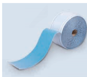
Systemanschlussstreifen R300 • sicher

Der Systemanschlussstreifen R300 ist speziell für den fachgerechten Anschluss der Gefitas® Feuchtigkeitsperre an die Mauerwerkssperre oder an aufgehende Bauteile (weiße Wanne) entwickelt worden. Mit dem R300 können die Innen- und Außenecken geformt werden. Darüber hinaus dient er zur Lagesicherung der Feuchtigkeitsperre.