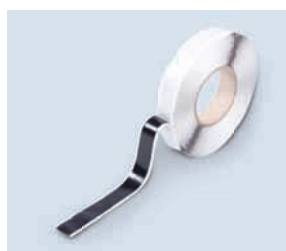
Dichtband • sorgfältig

Das Dichtband eignet sich ideal für den Anschluss der Gefitas® Abdichtungen an die Mauerwerkssperre sowie zum Verbinden der Kopfstöße der Bahnen.