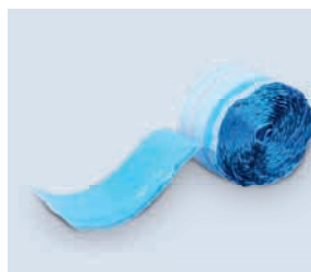
Systemanschlussstreifen R300 Plus • umfassend

Der Systemanschlussstreifen R300 Plus ist speziell für den fachgerechten Anschluss der Gefitas® Feuchtigkeitsperre an die Mauerwerkssperre oder an aufgehende Bauteile (weiße Wanne) entwickelt worden. Der R300 Plus wurde zusätzlich mit einem 10 mm starken Randdämmstreifen zur Herstellung der Randfuge im Estrich ausgerüstet.